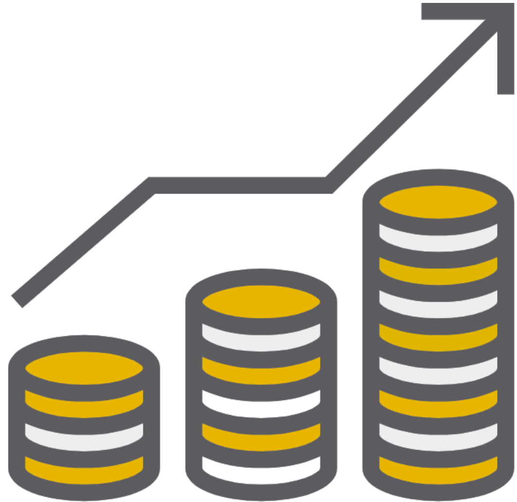
I flussi di ricavi